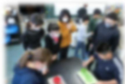
熱戦を繰り広げ、大いに盛り上がった「はしマスター選手権」

来年1月12日(金)、楽しい思い出を背負って、子どもたち全員が元気に登校して来ることを心待ちにしております。どうぞよいお年をお迎えください。