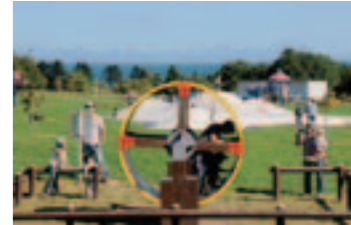
●まきばの冒険広場