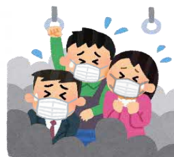
混雑した乗り物の中