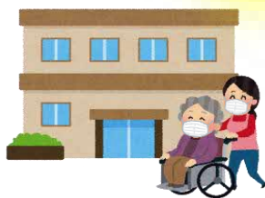
高齢者施設など に行くとき