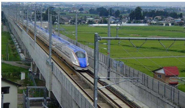
コンクリート製防音壁