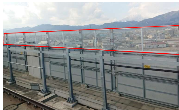
ポリカーボネート製防音壁