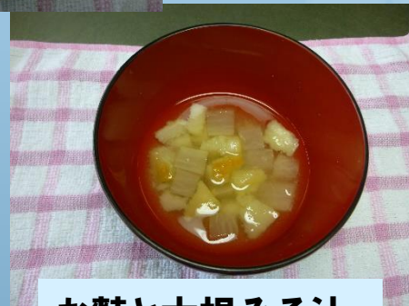
お麩と大根みそ汁