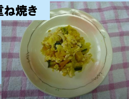
かぼちゃの重ね焼き

口をモグモグ左右に動かせるようになったら、奥の歯ぐきでつぶして食べられるように、やわらかく煮た7mm~1センチくらいの大きさのものをあげてみましょう。急に大きさを大きくしすぎたり、煮加減が固すぎると丸のみの原因になりますので、焦らず進めることが大切です。手づかみ食べの方が良く食べてくれる赤ちゃんもいますので、食パンや茹で野菜などを手づかみしやすい状態で食べさせてみましょう。足の裏が床やベビーチェア-の足乗せ台につくと、姿勢が安定し、しっかり噛んで食べることが身につきます。